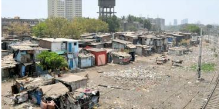
Pobreza en México: aún estamos lejos de erradicarla.